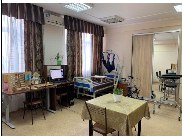
Кабинет социально-бытовой адаптации с учебным жилым модулем