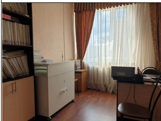
Кабинет консультирования/ Кабинет выдачи технических средств реабилитации

Кабинет предназначен для оказания услуг в целях повышения коммуникативного потенциала получателей социальных услуг, имеющих ограничения жизнедеятельности, а также социально-педагогических услуг (обучение практическим навыкам общего ухода за тяжелобольными).