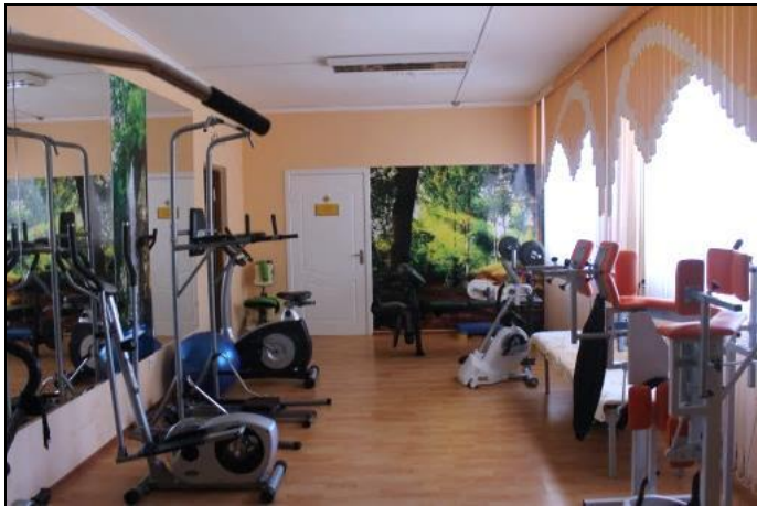
Зал лечебной физической культуры

Кабинет (зал) предназначен для проведения занятий по ЛФК с учетом особенностей течения заболевания, функционального состояния организма, общей физической работоспособности. Кабинет оснащен различным оборудованием, реабилитационными тренажерами с программным управлением, позволяющим дозировать амплитуду и интенсивность движения, спортивными тренажерами для физического развития.