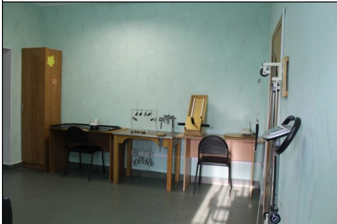
Кабинет механо- и кинезитерапии

Кабинет (зал) предназначен для проведения занятий по ЛФК с учетом особенностей течения заболевания, функционального состояния организма, общей физической работоспособности. Кабинет оснащен различным оборудованием, реабилитационными тренажерами с программным управлением, позволяющим дозировать амплитуду и интенсивность движения, спортивными тренажерами для физического развития.