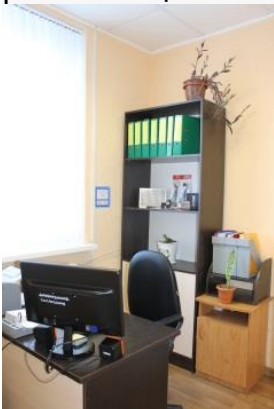
Кабинет выдачи технических средств реабилитации

В кабинете производится выдача технических средств реабилитации, приобретенными учреждением за счет краевого бюджета в порядке, установленном министерством социального развития и семейной политики Краснодарского края, а также обучение инвалида и при необходимости членов его семьи пользованию техническими средствами реабилитации.