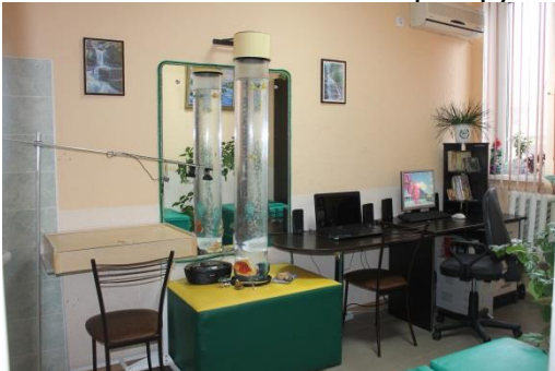
Кабинет психологической разгрузки

Кабинет оснащен специальным оборудованием для создания комфортного психологического климата, методической литературой и наглядными пособиями. Здесь проводятся индивидуальные и групповые занятия на развитие психических процессов, эмоционально – волевой сферы, психологическое консультирование, ориентированное на решение социально – психологических задач.